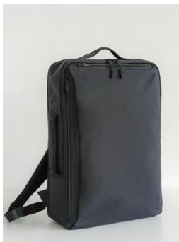
①3WAY 出張 Biz Bag