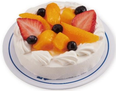
彩りフルーツケーキ