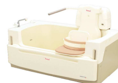
機械浴室パンジー (酒井医療)