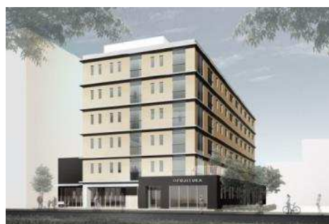
「かがやきの とき 季 高松藤塚町」 外観イメージ

大京グループの穴吹工務店では、不動産活用推進室「高齢者住宅事業推進チーム」がサービス付き高齢者向け住宅事業を開始し、1月にグループとして第2号となる（（仮称）「かがやきの とき 季 高松藤塚町」：香川県高松市、鉄骨造6階建、全60戸、デイサービス（通所介護）、調剤薬局などを併設した複合施設、2015年秋入居開始予定）を着工いたします。