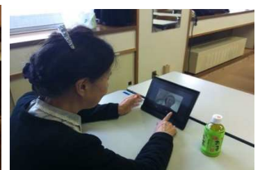
左：かがやきの とき 季 中野南台（外観写真） 中央：共用施設（イメージ） 右：TV電話による見守りサービス「見守りん」（イメージ）