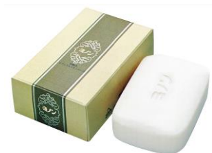
「ミノン」（現・「ミノンスキンソープ」） 1973年発売

赤ちゃんからご高齢の方までお使いいただけるブランドであり続けるために、一貫して今もこの考え方を守っています。