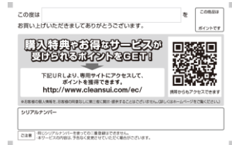
キャンペーンPOP(左/左中)と、キャンペーンシール(右中)、クリンスイポイント登録カード(右)