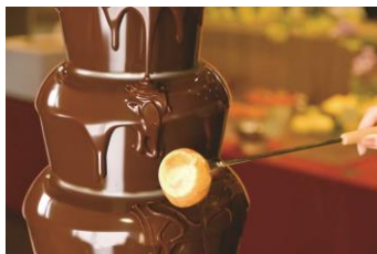
チョコレートファウンテン

今後も皆さまにお楽しみいただける企画を実施予定です。皆さまのご来店を心よりお待ちしております。