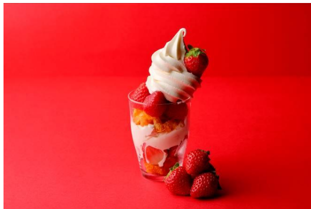
自分でつくるカスタマイズパフェ

2024年7月にメロン、10月にシャインマスカットをメインとして、たくさんのお客さまにお楽しみいただいた「フルーツ&スイーツビュッフェ」の2025年第1弾を開催いたします。今回はイチゴをメインに、フルーツ・スイーツ各種、ジェノベーゼパスタやポトフなどのフードメニュー、更にワインも飲み放題で、全約40種のメニューをランチタイムにビュッフェ形式でご用意。大人も子どもも楽しい「チョコレートファウンテン」でイチゴにチョコレートをからめたり、ソフトクリームマシンを使って自分好みのカスタマイズパフェをつくり、SNSなどで体験をシェアしたり、おいしく楽しいひとときをお過ごしいただけます。スイーツだけではなく、カレーライスやサラダバー、パンも各種ご用意いたしますので、ランチとしてもぜひご利用ください。