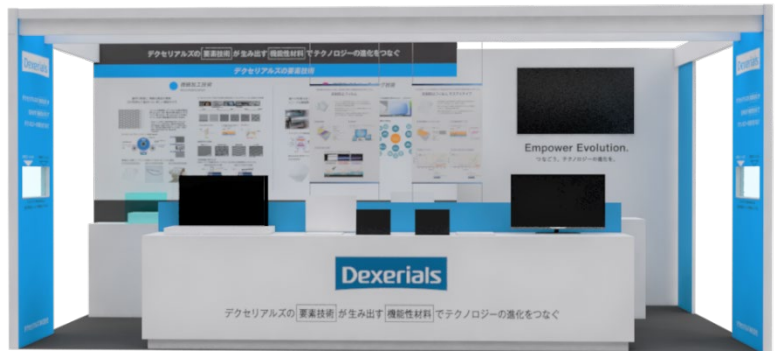
1月出展予定の nano tech 2025 のブースイメージ

当社では、すでにお取引のあるお客さまのみならず新規のお客さまにも、製品や技術、ソリューションについて理解を深めていただきたく、定期的に展示会出展を行っています。