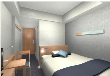
スーペリア街側セミダブル(イメージ)