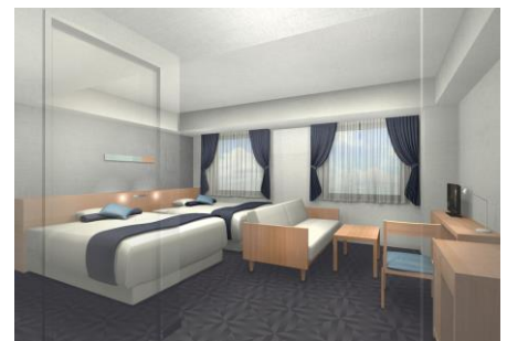
スーペリア海側ファミリー(イメージ)