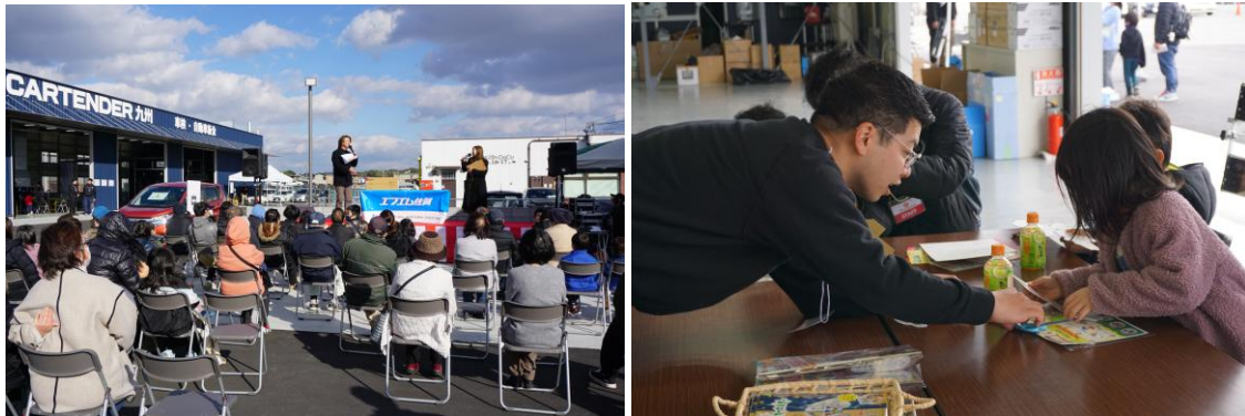
ご参考：SCT九州オープニングイベントの様子（実施日：2024年1月7日）