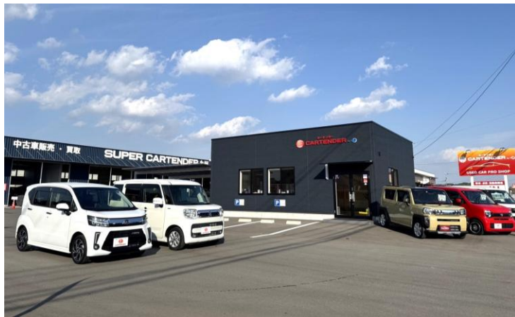
スーパーカーテnder九州 外観