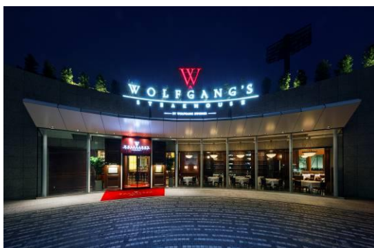
シグニチャー青山店 外観