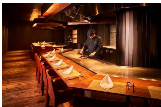
Teppan 銀座店 内観