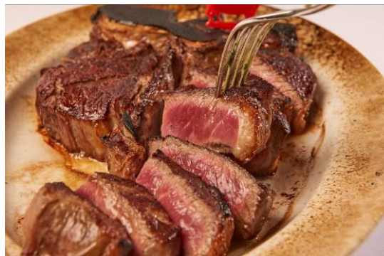
プライムステーキ(2名様用)