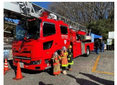
《お子さま用制服試着体験》