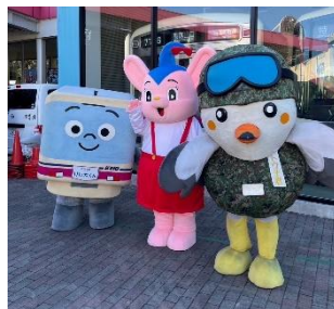
《キャラクターグリーティング》