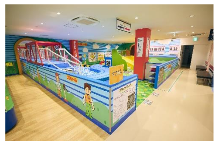
《京王れーるランド》

【報道関係者のお問い合わせ先】京王電鉄 広報部 武井・富岡・加藤・安蛭 TEL.042-337-3106 Mail:koho.pub@keio.co.jp