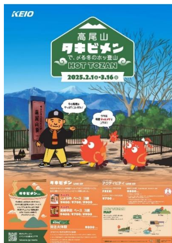
《「タキビメン」ポスタービジュアル》