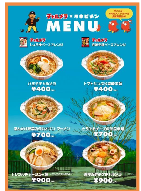
《「タキビメン」メニュー》