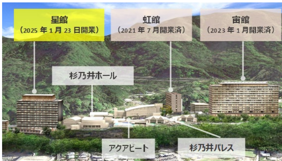
別府温泉 杉乃井ホテル 全体イメージ

共用施設については、2020年に最大500名を収容可能な「大宴会場」をもつ共用施設「杉乃井ホール（旧ひかりホール）」のリニューアルが完了し、2022年12月には、アミューズメント施設として親しまれてきたボウリング場「スギノイボウル」が、ボウリング、デジタル射的、ビリヤードやダーツなどの8つのコンテンツを持つエンターテインメント施設「SUGINOI BOWL & PARK」に生まれ変わりました。また、屋外型温泉施設「アクアガーデン」の噴水ショーや、屋内レジャープール「アクアビート」の壁面を活用したプロジェクションマッピングのプログラムを刷新し、2023年7月には、杉乃井ホテルの象徴である大展望露天風呂「棚湯」が20年ぶりにリニューアルしました。このたび、大規模リニューアルのフィナーレである「星館」の開業にあわせ、杉乃井パレス1階売店・ゲームコーナーの「星宙（ほしぞら）こみち SHOP & GAME」がオープンします。