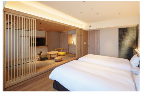
デラックス和洋室

夜空に光る星のように人々の心をときめかせる施設を目指し命名された館名にちなみ、客室のカラーコンセプトは「夜半（よわ）」「宵（よい）」「暁（あかつき）」の3種類で、夜の始まりの空から深い夜の空、夜明け前の空に浮かぶ星のひかりをイメージしています。