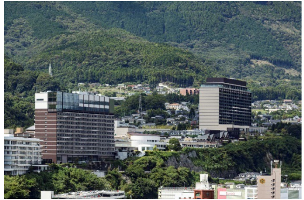
「別府温泉 杉乃井ホテル」全景

新築、建て替えを含めた計3棟の客室棟の開発や、共用施設の改装、インフラ整備などを行う約5年間のプロジェクトです。2021年7月にアクティブな滞在に適したカジュアルな客室棟「虹館（客室数155室）」が開業、2023年1月にはラグジュアリーステイをかなえるフラッグシップ棟「宙館（客室数336室）」が開業しました。最終客室棟として「星館（客室数300室）」が2025年1月23日（木）に開業し、大規模リニューアルは全面完了となります。