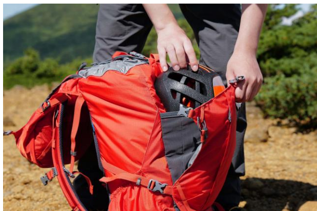
ストレッチ素材のマチでヘルメットも収納可能