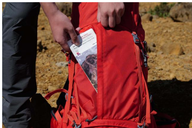
マップや小物の収納に便利な ジッパー付ポケット