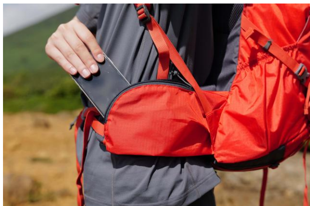
大画面のスマートフォンも収納可能