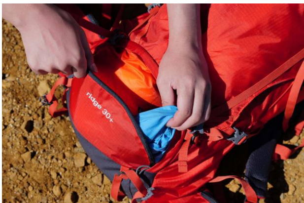
下部の荷物を出し入れできる 便利なボトムアクセス