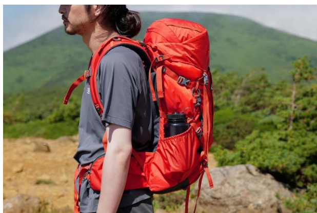
1Lのボトルも収納可能