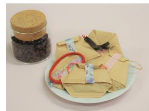
コーヒーグラウンズを活用した消臭剤