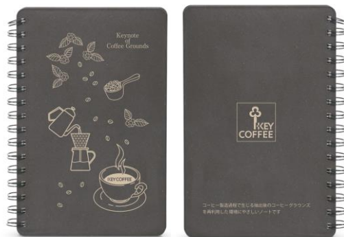
『Keynote of Coffee Grounds』

https://onlineshop.keycoffee.co.jp/shop/g/gZK015000/