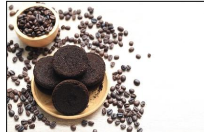
「コーヒーグラウンズ」イメージ