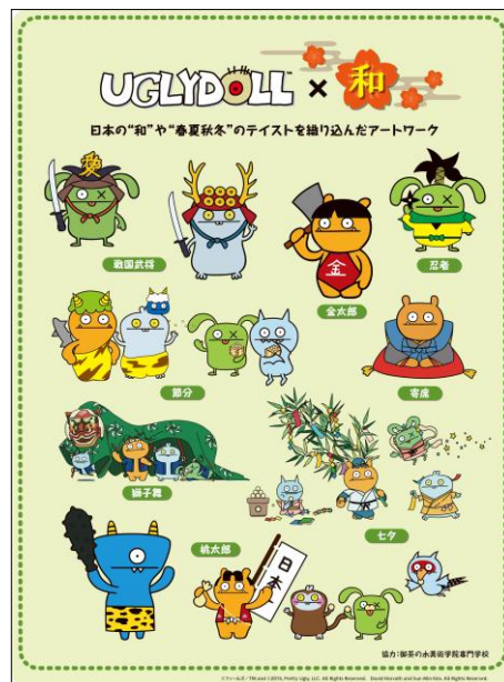
↑ 右上、「アグリドール」×「日本の和」