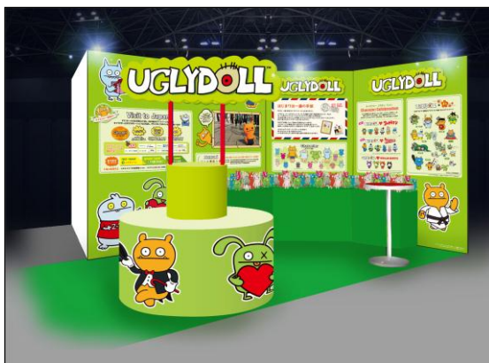
▲「アグリドール」ブースイメージ

弊社はコンテンツビジネスのノウハウを駆使し、女子高生や、20歳～34歳の女性(F1層)をメインターゲットに置き様々なキャラクターとのコラボレーション計画を進め、ブランドロイヤリティを高めて参ります。また、アパレルやファッションを中心としたタイアップや、生活雑貨、書籍、カプセル・トイ、デジタルコンテンツなどの総合的なライセンス事業を通じてブランドの認知拡大と、市場の開拓を目指します。