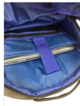
15inch 対応 PC 専用ポケット設置