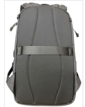
通気性抜群背中メッシュ