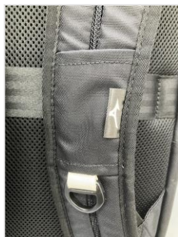
D カンストラップに硬式野球 ボール用革材を再利用