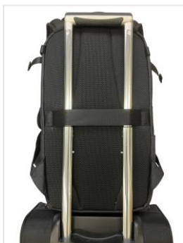
キャリーケース用 ベルトを搭載