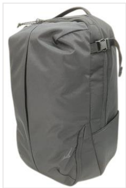
バックパック正面