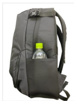
便利な両サイドポケット