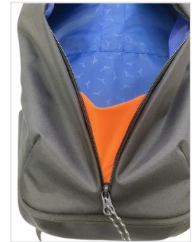
大容量のフロントポケット 内部の一部には使用できな かった競泳水着生地を採用