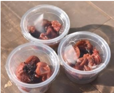
《京王百草園手作りの梅干し》