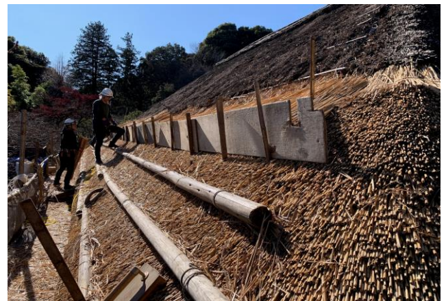
《茅葺屋根葺き替えの様子》