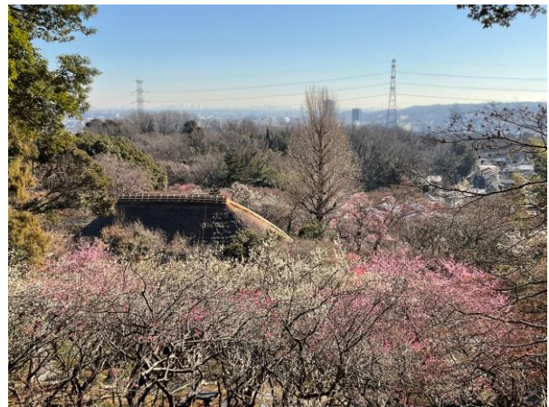
《園からの眺望（昨年の様子）》