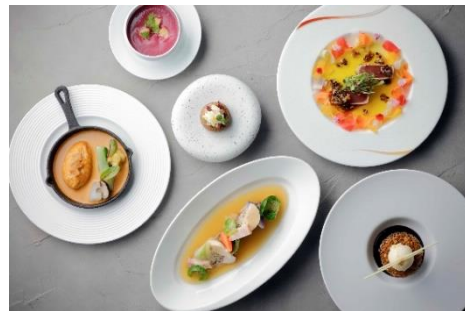
ディナーコース イメージ