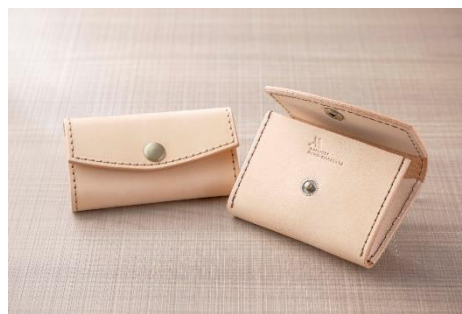
キーケース（左）とコインケース（右） イメージ

地元白浜町でアトリエを構える「 シュエットドール CHOUETTE D'OR」のレザー職人をお招きし、和歌山県産の革細工を使ったキーケースまたはコインケース作りをご体験いただけます。サイズに合わせて切り出した革に、お好みの糸色で手縫いし、ホテルオリジナルの刻印やイニシャルを入れることも可能です。完成した製品は当日お持ち帰りいただけます。長くご愛用いただける和歌山県産の革製品。旅の思い出や大切な人への手作りプレゼントとして、是非この機会にご体験ください。