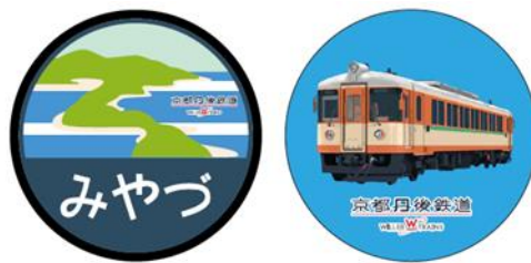
リバイバル列車『みやづ号』限定缶バッジ