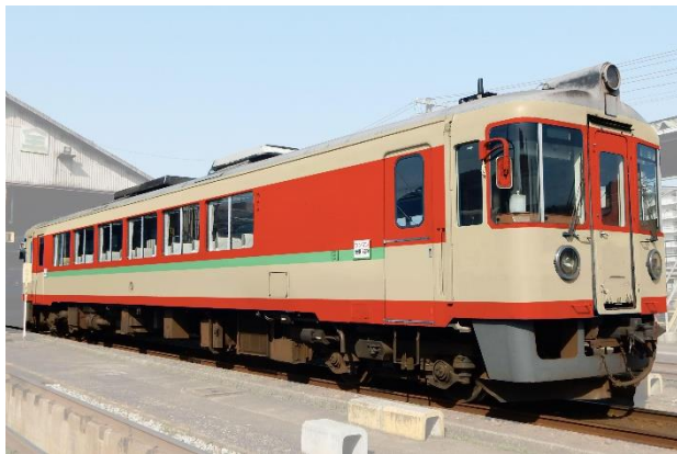
車両ラッピングイメージ