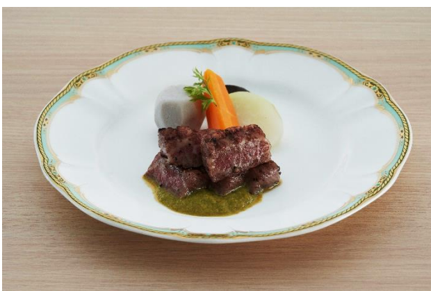
強肴 琥珀和牛ステーキ～九条葱ソース～