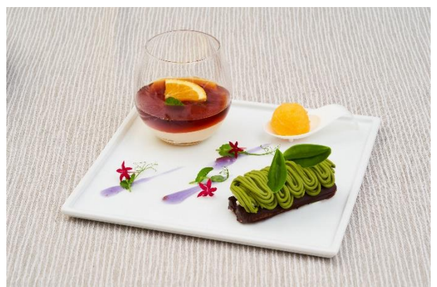
アシェットデセール