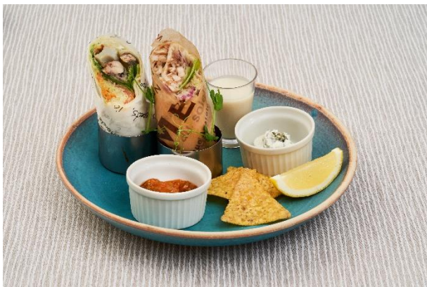
森と海のトルティーヤ