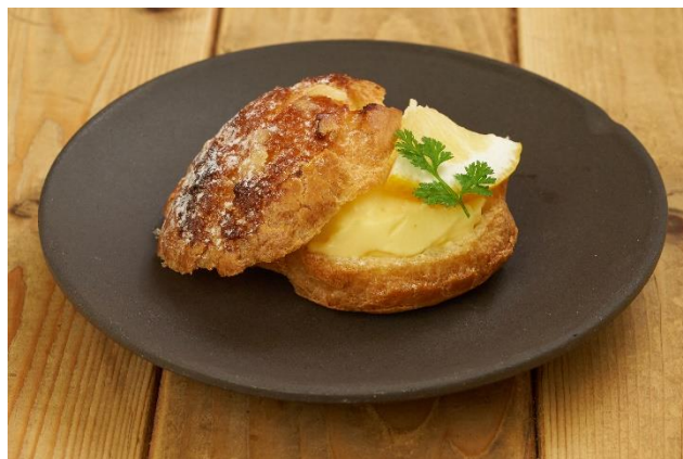
レモンのシュークリーム