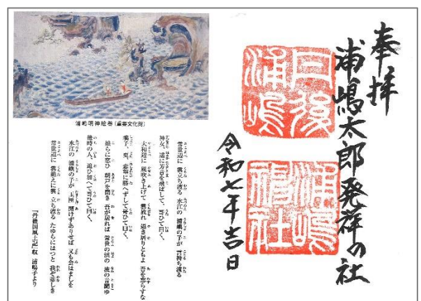
浦嶋神社 丹後くろまつ号限定御朱印