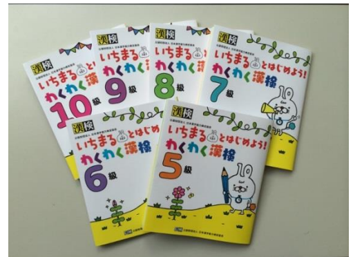
5級・6級・7級・8級・9級・10級の 全6冊を新発売

【商品コンセプト】漢字学習や漢検の「入門編」となる教材。家庭や学校での短い学習時間で、最後まで楽しみながら気軽に学べる問題集。