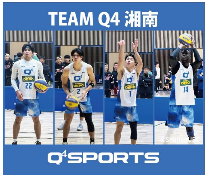
エキシビジョンマッチ出演チーム