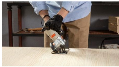
丸ノコ 直線・傾斜カット