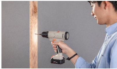
ドリルドライバー 穴あけ・ネジ締め