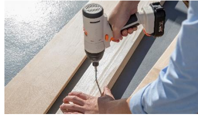
インパクトドライバー 穴あけ・ネジ締め