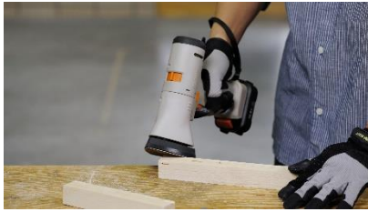
サンダー 研磨・面取り