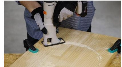
ジグソー 直線・曲線カット