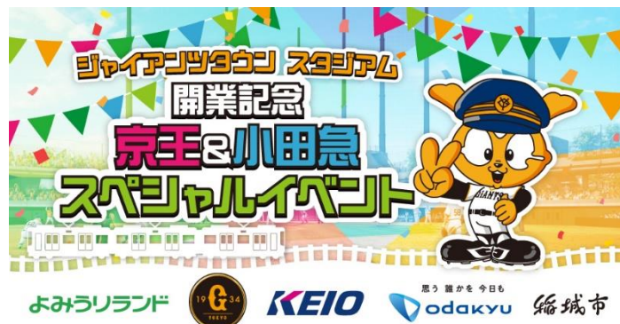
《イベントキービジュアル》

本企画を通し、5者それぞれが連携を強化することで、京王電鉄・小田急電鉄沿線ならびに稲城市の活性化および、よみうりランド・ジャイアンツタウンスタジアムへの旅客誘致を図ってまいります。