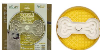
ウィートイエロー色