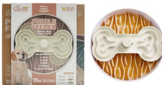
コーラルピンク色