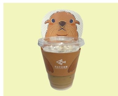
オットセイのカップスリーブ イメージ