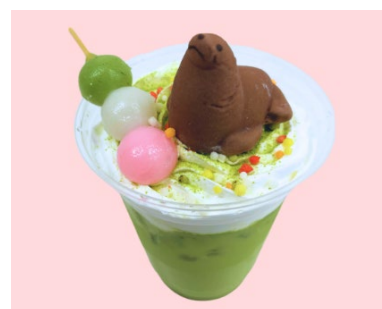
ぶかぶかオットセイのお花見ラテ イメージ