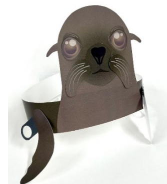
ぱたぱたオットセイお面 イメージ

オットセイの顔をじっくりと観察しながら福笑いのようにオットセイの耳や目をのり付けしてお面を作ります。完成したお面は前あしをぱたぱたと動かして遊ぶことができます。ご参加いただいた皆さままで完成したお面をかぶってオットセイの群れを作って楽しみながら、オットセイを身近に感じていただくワークショップです。