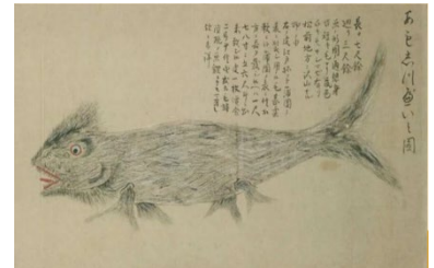
江戸時代に描かれたオットセイの子どもの絵（あもしつべい之図）

エントランスからオットセイプールエリアに至るまでの館内各所に、これまで他のいきものと間違えられてきたオットセイの切ない状況をお伝えするパネルを展示します。「アシカやアザラシと間違えた SNS 投稿をされるオットセイ」や「歴史的文献でも間違えられてきたオットセイ」など、切ない実例を多角的にご紹介します。