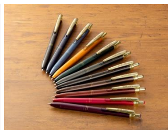
▲定番商品「サラサグランド」