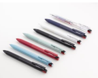
▲定番商品「サラサクリップ 3C」