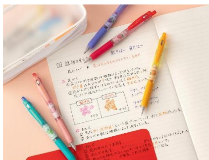
▲勉強もはかどっちゃう！