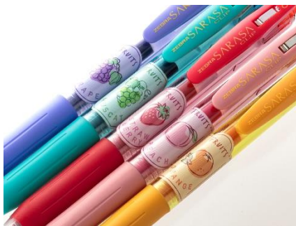
▲ステッカー風のワンポイントデザイン