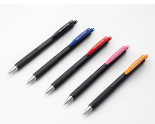
▲定番商品「サラサナノ」

※1 日経 POS サービス 2012年1月～2024年12月文具市場（ジェルボールペン）各年間累計販売本数より。全国 GMS/SM/CVS/DRG 計