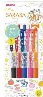
▲「サラサクリップ 20周年香りつき」(2023年)

香りつき商品はいずれも販売期間が短かったため、大人になったお客様が昔使っていた香りつきペンのことを思い出し、2017年からの8年間で約120件もの再販を希望する声などがお客様相談室に寄せられています。