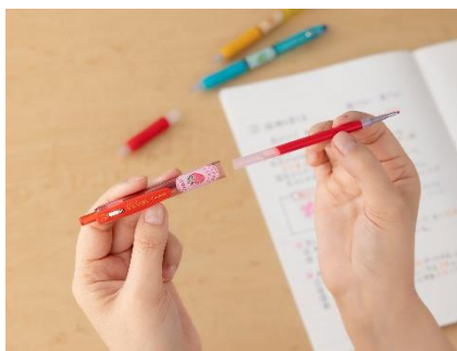
▲替芯で長く楽しめる

*** この商品に関する報道関係の方のお問い合わせ先 *** ゼブラホールディングス株式会社 プロダクト&マーケティング部 PRチーム：池田・鈴木 TEL:050-1706-0335 e-mail: tiked@zebra.co.jp / ysuzuki@zebra.co.jp *** この商品に関する消費者の方のお問い合わせ先 *** ゼブラ株式会社 お客様相談室 TEL:0120-555335(平日9時~17時) https://www.zebra.co.jp/