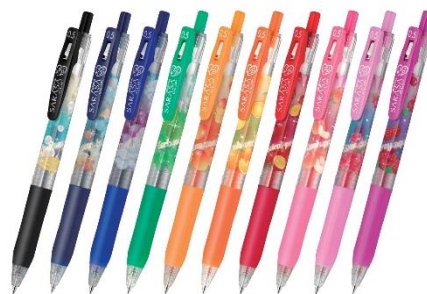
▲「サラサクリップ フレッシュパラダイス」(2012年)