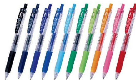
▲定番商品「サラサクリップ」

さらさらとした軽い書き心地と、濃くあざやかな発色が特長のジェルボールペンです。2003年の発売以降、20年以上インクがなくなるまで書ききれぬ品質を追求しています。同じサラサシリーズでは、社会人を対象にした3色ジェルボールペンの「サラサクリップ 3C」やビンテージカラーで高級感溢れるジェルボールペン「サラサグランド」、極細タイプでもさらさら書ける「サラサナノ」など、時代のニーズに合わせて商品のバリエーションを増やしています。