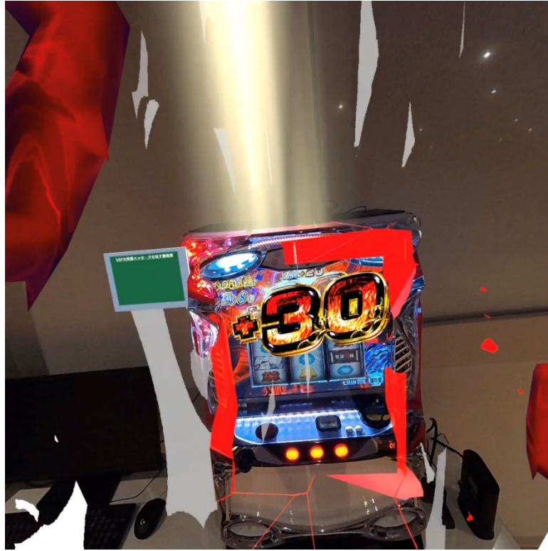
* 本体の演出シーケンスと完全連動した演出映像。MR 演出により、液晶画面から文字やキャラクターが飛び出してくるように見える