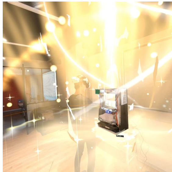
* MR ならではの大大当たり演出。没入感ある演出で大大当たり時の高揚感を増幅、パチスロの遊技体験をリッチに拡張する（左は遊技者の視点／右は第三者の視点）

今回公開する「MR パチスロ」の要素技術は、パチンコ・パチスロ上での“コンテンツの没入感・ストーリー体験の向上”や、“射幸性を抑えながらも豊かな遊技体験もたらず演出の質の向上”を通じて、既存のパチンコ・パチスロファンに加えて、まだパチンコ・パチスロを遊技されたことのない方々にも幅広くお楽しみ頂けるエンターテインメント体験を創出するという、