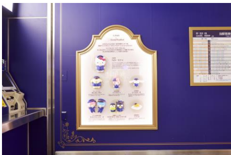
《駅係員紹介スポット》