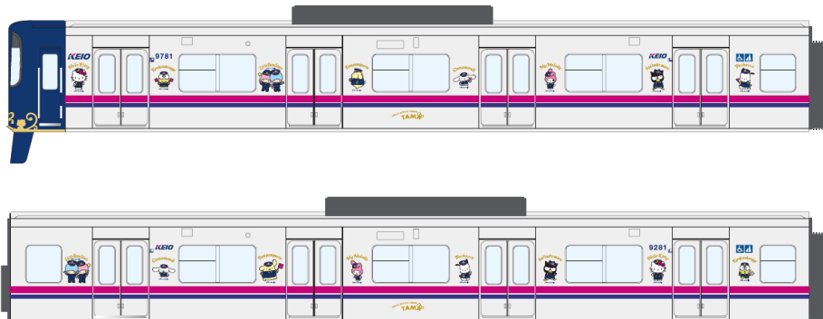
《外装ラッピング(イメージ)》

概 要：京王多摩センター駅の装飾に合わせた濃紺とゴールドの落ち着いた色味を基調とし、正面・側面にはサンリオの人気キャラクターたちが京王電鉄の制服を着用したデザインとなっています。京王多摩センター駅の装飾とあわせてサンリオの世界観をお楽しみいただくことができます。