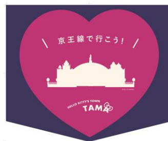
《オリジナルヘッドマーク》