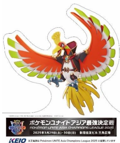
《スポットに設置される大会告知パネル(イメージ)》

https://stag.keio.co.jp/assets/pdf/20250221_PUACL2025routemap.pdf