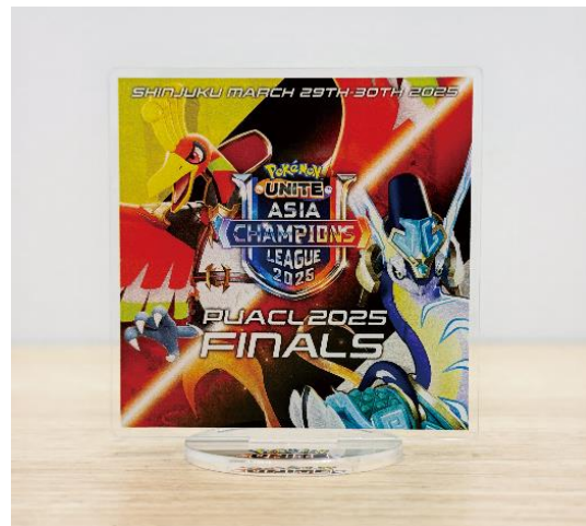
《オリジナルグッズ(イメージ)》