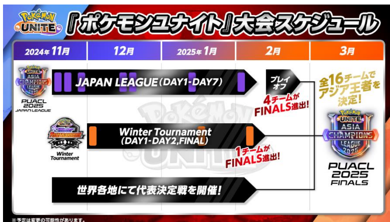
《大会スケジュール》