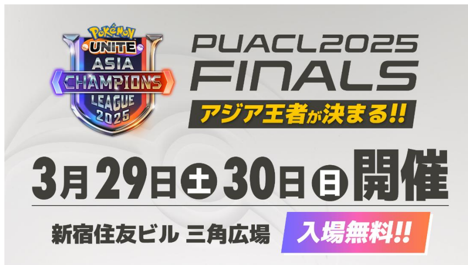
《大会会場イメージ》