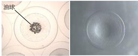
(左) チンアナゴの受精卵 (右) ニシキアナゴの受精卵