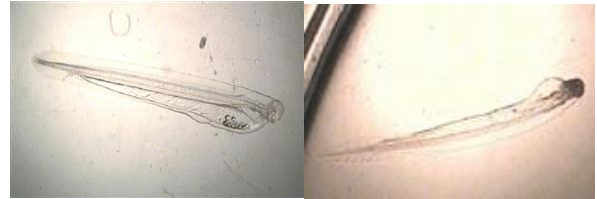
(左) チンアナゴの稚魚 (右) ニシキアナゴの稚魚