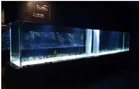
すみだ水族館 チンアナゴ・ニシキアナゴの展示水槽 幅 550 cm 奥行 80 cm 水深 133 cm 飼育には人工海水を使用。

ウナギ目アナゴ科の仲間。温暖で潮通しの良い砂地に生息。巣穴を掘って生活し、時には大きな群れを作る。日中は体を伸ばし流れにのってきた動物プランクトンを捕食する。