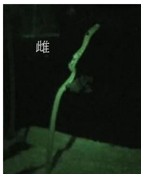
チンアナゴ 放卵の様子

※これまで、ウナギ目の産卵行動の動画記録について、文献による報告はされておられません。（日本大学ウナギ学研究室調べ）