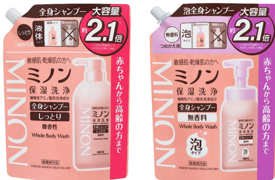
左から、「ミノン全身シャンプーしっとりタイプ」「ミノン全身シャンプー泡タイプ」つめかえ用大容量

第一三共ヘルスケア株式会社（本社：東京都中央区、社長：内田高広、以下「当社」）は、敏感肌向けブランド「ミノン」から、赤ちゃんから高齢の方までお使いいただける全身洗浄料「ミノン全身シャンプーしっとりタイプ」「ミノン全身シャンプー泡タイプ」（いずれも医薬部外品）のつめかえ用大容量を本年4月14日（月）に追加発売します。