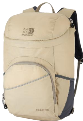
カラー: Pale Khaki