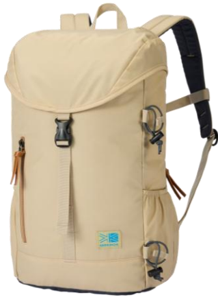
カラー: Pale Khaki