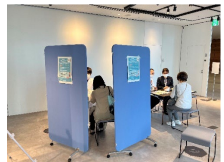
【参加型イベント（昨年度の様子）】

本学の医師と横浜市の保健師が、腎臓に関する治療、検査結果の見方、生活習慣の改善（例：食事、運動）等の健康相談に応じます。