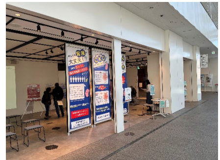
【展示イベント（昨年度の様子）】

【内容】慢性腎臓病（CKD）の早期発見・予防方法や治療等についての展示（タペストリ、パネル、動画）