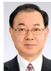
田村 功一 教授