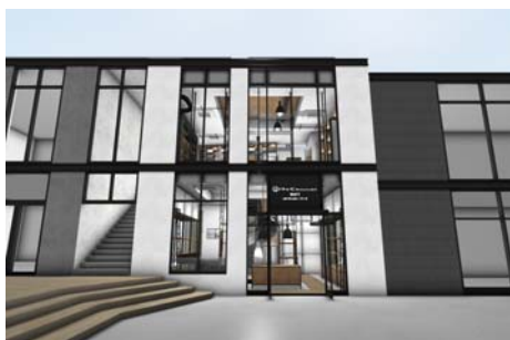
《MSPC PRODUCT sort》