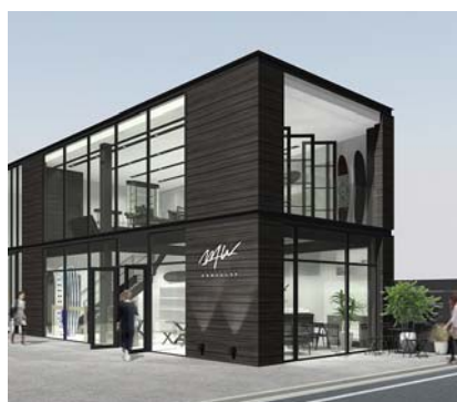
《WTW SURF CLUB》