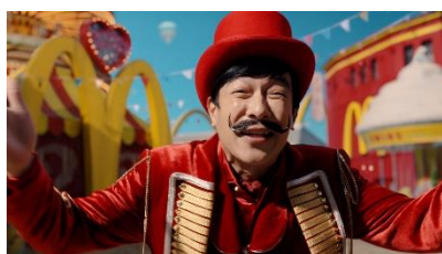
堺さん 「あなたのおトクが私のスマイル！ ああ！おトクという言葉は どうして私をこんなにワクワクさせる のか！」