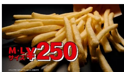
NA)マックフライポテト M・L サイズ