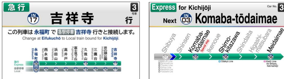
《車内案内システム更新》

全てのお客さまに安心してご利用いただけるよう、多言語表記が可能な車内案内表示器に更新するほか、開いているドアをチャイム音でお知らせする装置を設置します。