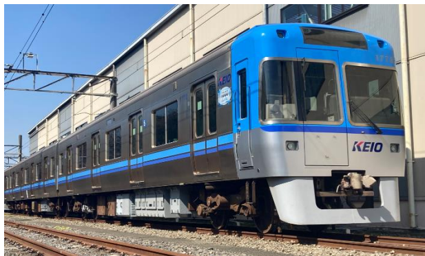
《井の頭線1000系（自動運転設備搭載車両）》

今後も、 技術革新を促進し、お客さまサービス向上や働きやすい職場環境の実現、省エネ運転によるCO 2 排出量削減により、持続可能な鉄道事業を目指してまいります。