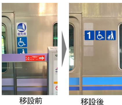
《ピクトグラム移設前後の比較》

ホームドア整備に伴い、ピクトグラム（車いすステッカー・ベビーカーステッカー）・正面の車両番号をより見やすくなるよう上部に移設するほか、自動運転設備搭載車両を区別するために、車体外観にアクセントライン・シンボルマークを追加します。若手社員が考案したデザインで、シンボルマークは井の頭線の「井」の字がモチーフとなっており、編成ごとのカラー名称をあしらっています。また、今回の改造に合わせ、乗務員室と客室間の仕切り窓を一部拡大し、お子さまが前面展望を楽しめるようにします。