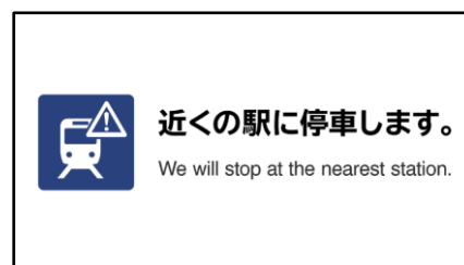
《車内ビジョン表示》