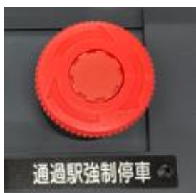
《通過駅強制停車ボタン》

車内トラブルの発生時に乗務員が操作することで、最寄りの駅に強制的・自動的に定位置に停車させる機能を導入します。また、この機能を操作すると自動的に車内ビジョンに「近くの駅に停車します」と表示されます。