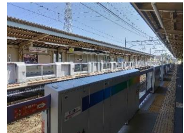
《ATCと自動運転の走行イメージ》