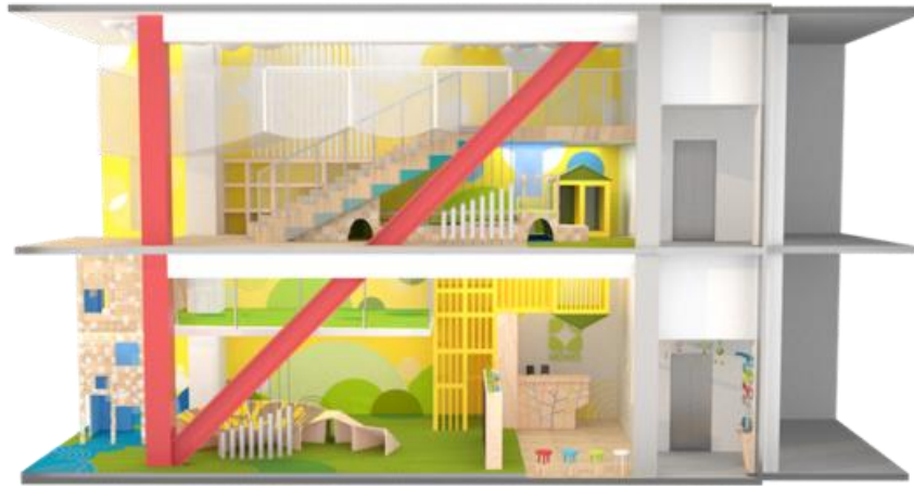
2層吹き抜けの空間