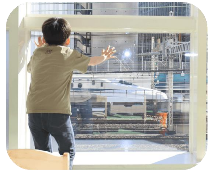
電車や新幹線の往来が見える線路を 見下ろすロケーション