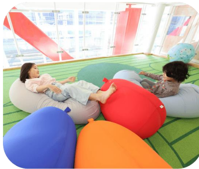
リラックスしてゆっくり遊べる エリアも設置