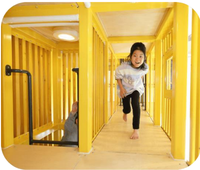
縦方向に自由自在に行き来できる フロア