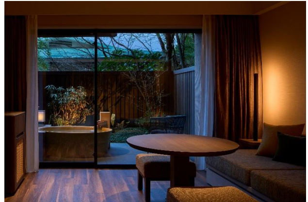
ラフォーレ箱根強羅 湯の棲 綾館 客室