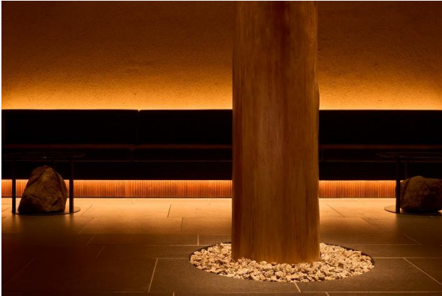
ラフォーレ箱根強羅 湯の棲 綾館 フロント