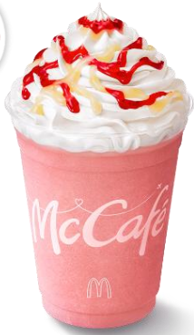
※いちご果汁1%使用 ※画像はイメージです