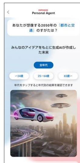
AIによる集合知公開画面

来場者の皆様が考える「未来社会」をアイデアとして投稿いただき、AIを使って集合知(アート、要約文)を作成し、公開