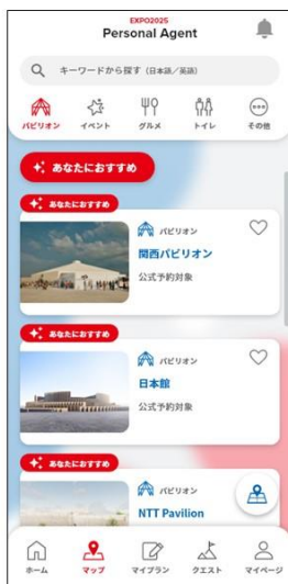
AIレコメンド画面 (施設レコメンド)

現在地から会場目的地まで最適なルートで案内。また、会場全域でARによるルート案内も利用可能