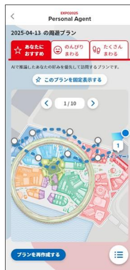
AIレコメンド画面 (コースレコメンド)

AIでの嗜好推定により、その人の興味にあったおすすめのパビリオンやイベントなど次の行動をレコメンド