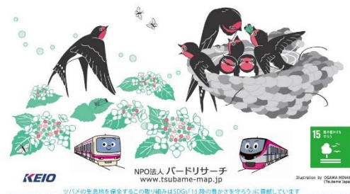
《フン受け板デザイン》