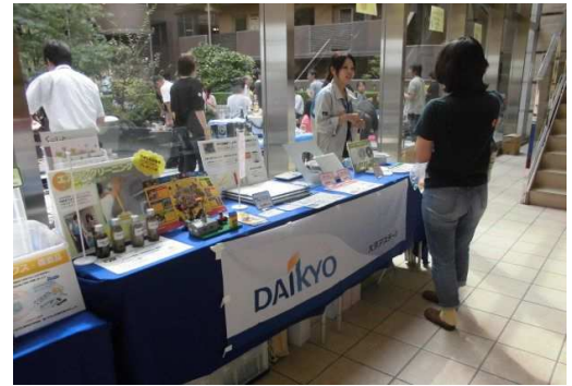
マンション共用部分で行うイベントの様子

マンションの排水管清掃などに立ち会う形で居住者宅へ出向き、住まいの“お困りごと”に耳を傾け、解決の手助けをする女性専門職です。例えば、室内の専有設備の使い方や不具合については、戸別訪問でお手入れのアドバイスやサポート窓口の案内をするほか、立地環境や築年数といったマンションの特性を掴み、支店スタッフと共に室内の点検・修理相談会、換気ロフィルターや防災グッズの販売会等のイベントを現地で開催し、できるだけ多くの居住者に“お困りごと”の解決方法を提案するようにしています。また、マンションの共用部分に関する相談はその場で状況を確認し、支店のマンションアドバイザー（営業担当）やマンションサポーター（管理員）とも情報を共有します。