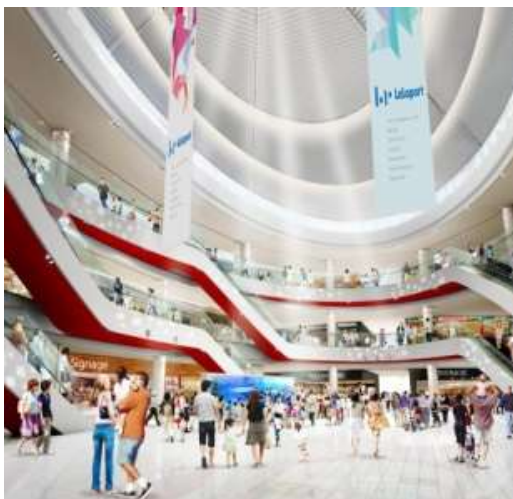
「ららぽーと EXPOCITY」イメージ(内観)