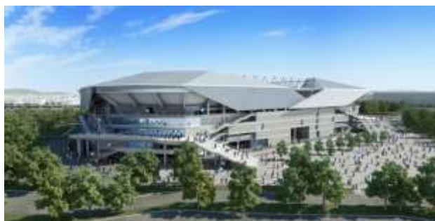
(仮称)吹田市立スタジアム イメージ(外観)

【参照】(仮称)吹田市立スタジアム HP http://www.field-of-smile.jp/