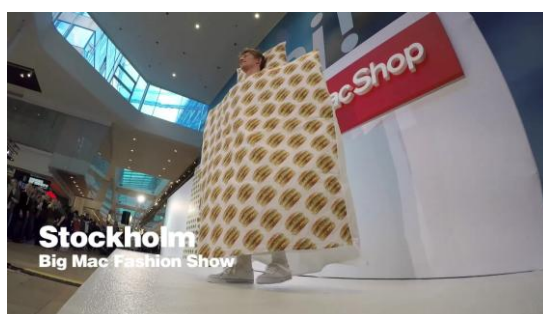
ストックホルムでは「ビッグマックファッションショー」