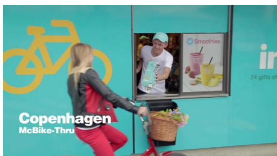
コペンハーゲンに登場した「自転車専用バイクスルー」