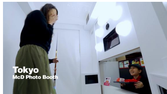
日本・東京でのサプライズの様子