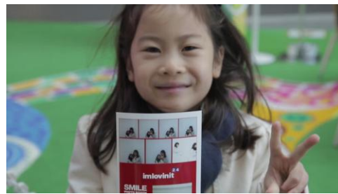
ご家族・お子様にも楽しんでいただいた