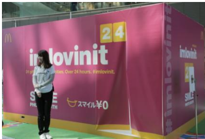
一日限定のフォトブース