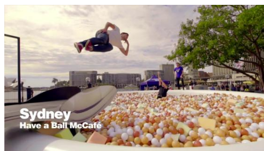
シドニーではコーヒーカップ型のボールプールが出現