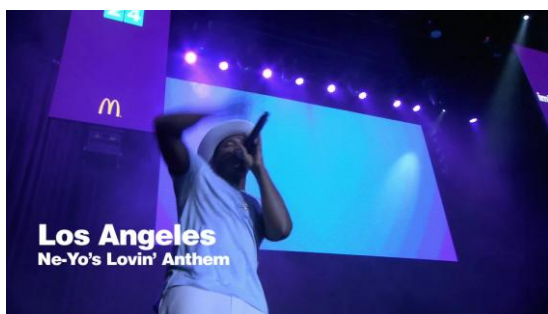
ロサンゼルスではNe-Yoがサプライズライブ