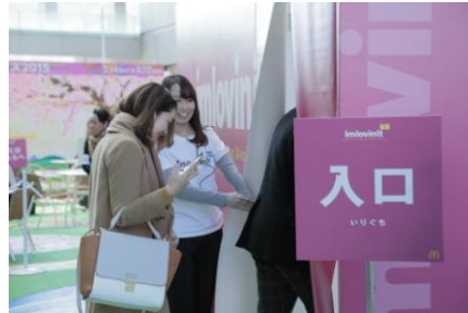
お客様はサプライズの内容を知らずに中へ