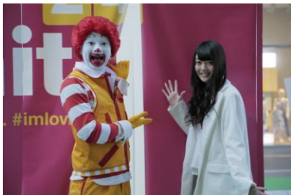
当日はドナルドも登場