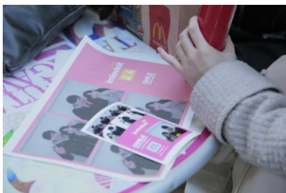
トレーマットにも写真がプリントされた