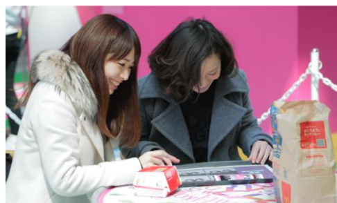
オリジナルのトレーマットで食事を楽しんでいた