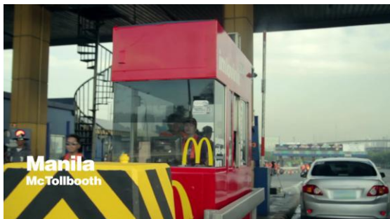
フィリピン・マニラでのサプライズの様子

※日本で実施されたイベント「SMILE PHOTO BOOTH」ではマクドナルドオリジナルの撮影ができるフォトブースを1日限りで設置し、撮影に来たお客様にある驚く方法で写真をプレゼントいたしました。当日の様子は当リリースの5ページ目、及び特設サイトをご参照下さい。(特設サイト URL http://imlovinit24.com/tokyo )