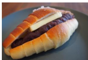
「OTTO ぱんカフェ」 塩パンあんバター