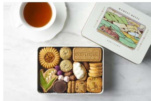
「万平ホテル」プレミアムクッキー缶