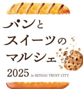
パンとスイーツのマルシェ 2025 ロゴ