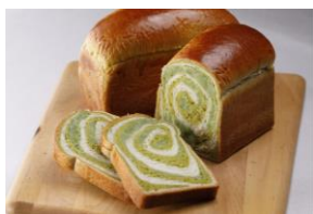
「ウェスティンホテル仙台」 ずんだブレッド