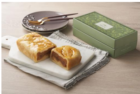
「万平ホテル」アップルパイ