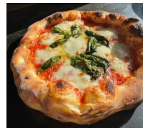
ピザ完成イメージ

参加方法:イベント当日、運営本部にて森トラスト公式 LINE のお友達画面を提示、先着順に受付