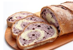
軽井沢ブルーベリー

軽井沢に3店舗、東京を中心に関東で16店舗を展開している創業90年越えの老舗ベーカリー「ブランジェ浅野屋」の出店が決定。「ブランジェ浅野屋軽井沢旧道本店」から、超ロングセラー商品の軽井沢ブルーベリーの他、軽井沢地域限定のパンなどを販売予定です。