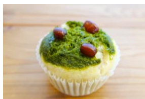
「天然酵母の蒸しパン専門 店 Once～わんす～」 抹茶クリームつぶあん