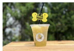
「MARUCHO FARM」 レモネード