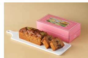
伝統のフルーツケーキ

創業130年を超える軽井沢のクラシックホテル「万平ホテル」の出店が決定。軽井沢土産として重宝されている、「万平ホテル」の伝統のフルーツケーキやカレーパン、信州リンゴジャムなどを販売予定です。