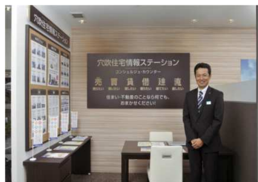
新サービス『住宅情報ステーション』 コンシェルジュ・カウンター