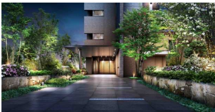
【エントランスアプローチ】