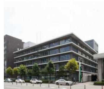
【大分中央郵便局/徒歩8分（約600m）】