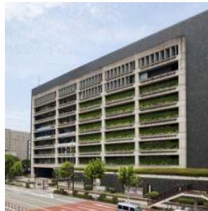
【大分市役所/徒歩7分（約520m）】