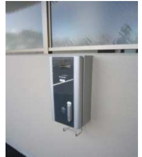
【EV コンセント・当社施工例】