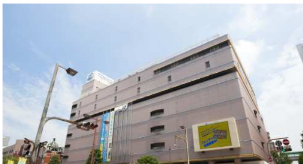
【トキハ本店/徒歩8分(約640m)】