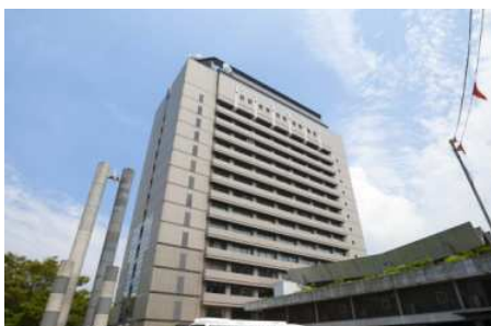
【大分県庁/徒歩3分（約190m）】