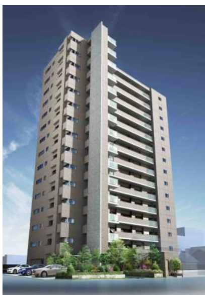
【北西側外観デザイン】