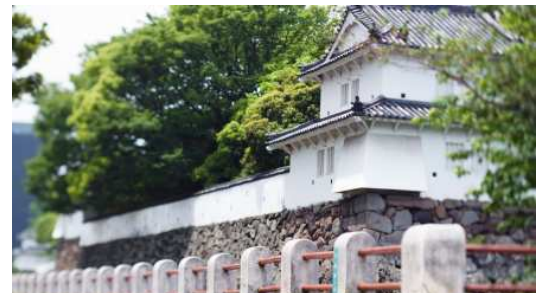
【大分城址公園/徒歩5分（約370m）】

また、この周辺は県庁や市役所、中央郵便局などの施設が集う行政の中心地です。そんな歴史と伝統がある官公庁街に本物件は誕生します。