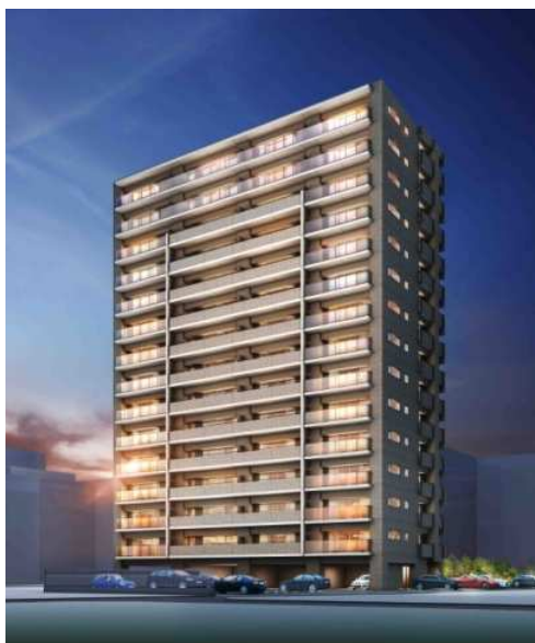
【北東側外観デザイン】

ガラスパネルを門型に組み大手門をイメージした外観デザインをはじめ、府内城の石垣をイメージした素材や豊富な植栽を配したエントランスアプローチ、ホテルのような上質な演出のエントランスホールなど住まいのすみずみまでこだわりました。