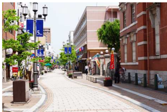
【府内五番街/徒歩4分(約270m)】

徒歩圏内には、老舗百貨店「トキハ本店」や人気の商店街「府内五番街」、2015年4月に全面開業する新駅ビル「JRおおいたシティ」など多彩な商業施設や交通施設が集積しており、市中心部ならではの高い利便性を享受することが出来ます。