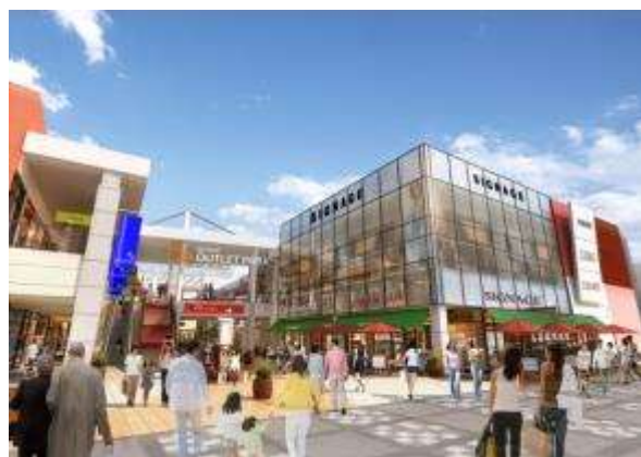
JR海浜幕張駅側エントランス(イメージ)

2000年の開業以来、今年で15年目を迎える当施設は、駅前立地というアクセスの良さと、キャリア女性に人気のブランド集積を背景に、施設周辺をはじめとする千葉県、さらに都内で働く多くの女性の方々にご利用いただいております。今回のグレードアップを機に、彼女たちの「もっとオトクにショッピングを楽しみたい」「仕事帰りにもオトクなブランドショッピングを楽しみたい」といったニーズに、さらに応えることができる施設へと成長を図ってまいります。