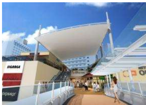
第3期棟ブリッジ(イメージ)