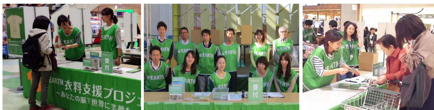
2014年11月(第12回)実施時の様子